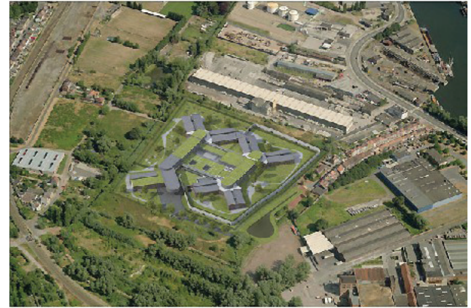
De opwaardering van de Wondelgemse Meersen gebeurt op basis van belangrijke locatievoordelen, zoals een goede bereikbaarheid, stedelijke omgeving en nabijheid van psychiatrische centra (o.a. PC Dr. Guislain en OBRA).