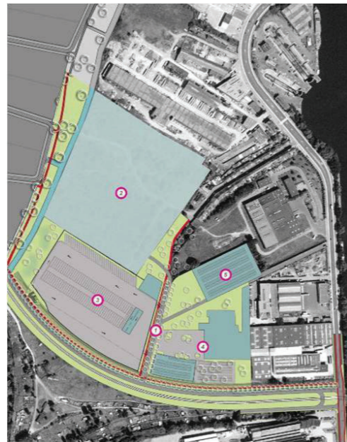
1 ontsluitingssas - 2 FPC - 3 bussteiplaats 4 reconversie Galveston - 5 parkeergebouw ifv FPC en De Lijn © PFPCG

Een vacant terrein in de Wondelgemse Meersen bleek meest geschikt zowel naar vorm van het terrein, beschikbaarheid als stedenbouwkundige inbedding. Het bouwterrein in het havengebied van Gent wordt omsloten door de Wiedauwkaai, een spoorweg, een toekomstige stelplaats van De Lijn, een recyclagebedrijf en de rivierbedding van de Lieve. Stad Gent voorzag een nieuwe ontsluiting langs de spoorweg om zo de bewoners van de Limbastraat te vrijwaren.